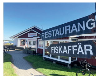
Hällevik, Dagmars hamnkrog.